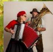
Avec la participation de La mini fanfare des balcons